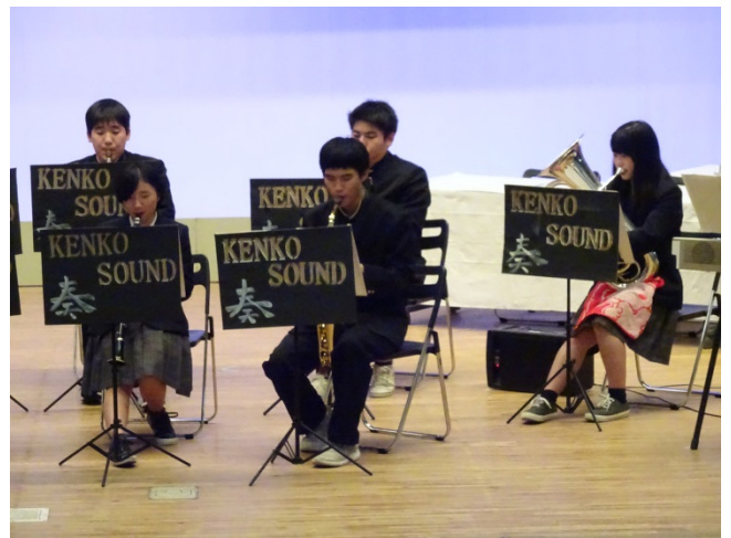
第 17 回高校生ものづくりコンテスト全国大会 演奏