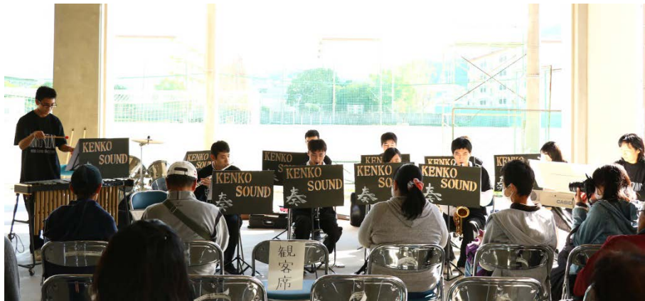
広工祭 プロティ演奏